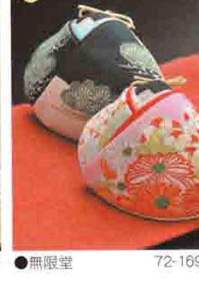
22 無限堂 72-1695