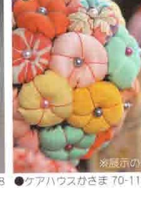
25 ケアハウスかさま 70-1100