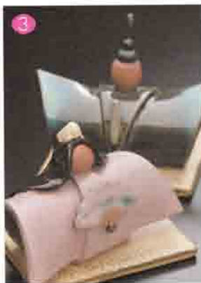
3 製陶ふくだ 72-0670