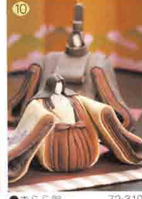
10 きらら館 72-3109