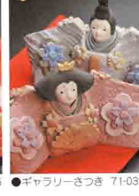
23 ギャラリーさつき 71-0321