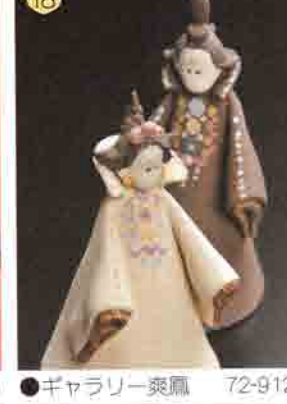
18 ギャラリー爽鳳 72-9121