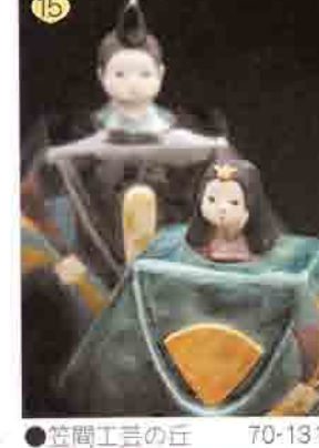
15 笠間工芸の丘 70-1313