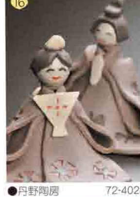
16 丹野陶房 72-4028