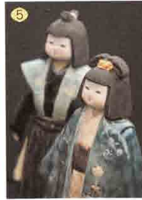
5 かつら陶芸 72-6688