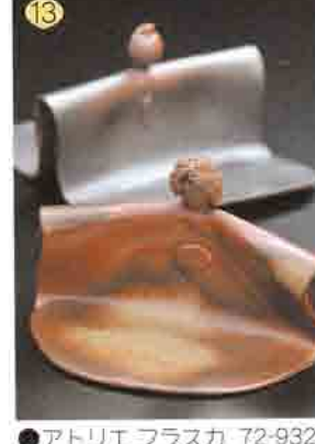
13 アトリエフラスカ 72-9322