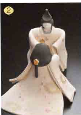
2 ギャラリー桜 72-0803