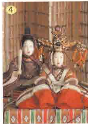
4 春風萬里荘 72-0958