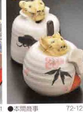
24 本間商事 72-1278