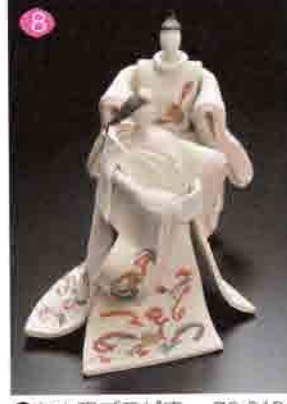
8 向山窯ブラザ店 72-0194