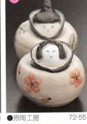
19 原陶工房 72-5511