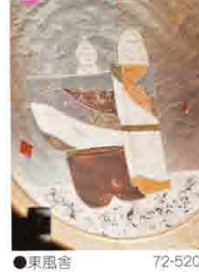
21 果風舎 72-5205