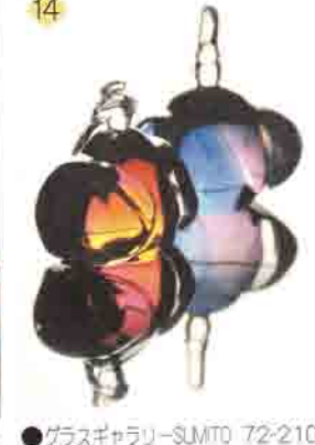
14 グラスギャラリー-SUMTO 72-2104