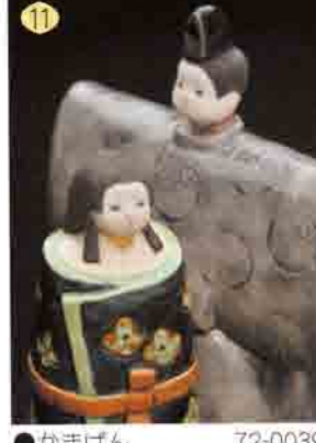
11 かまげん 72-0039