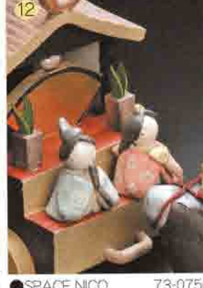
12 SPACE NICO 73-0750