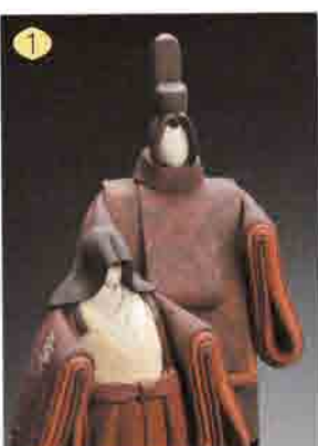
1 涼 72-0712