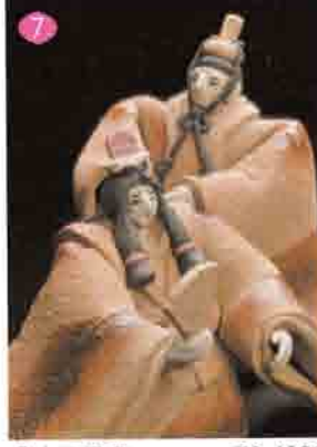
7 大津免窯 72-4323