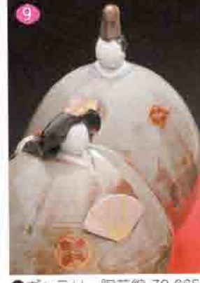
9 ギャラリー陶芸館 72-6650