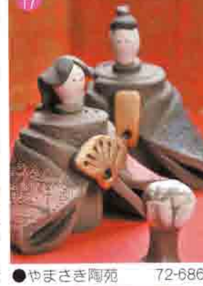
17 やまさき陶苑 72-6865