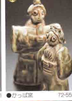
20 かつば窯 72-5521