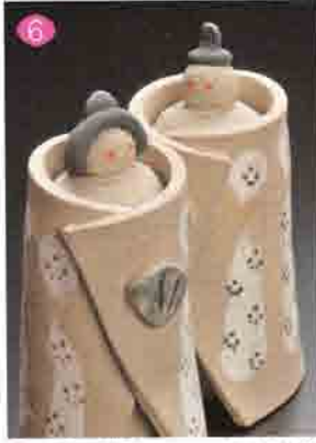
6 いそべ陶苑 77-3482