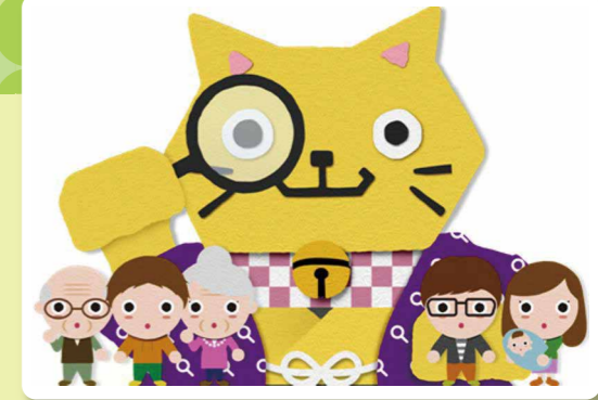
イメージキャラクター「かくにゃん」